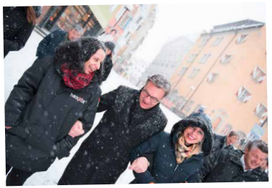
Wetterfest durch den Wahlkampf.