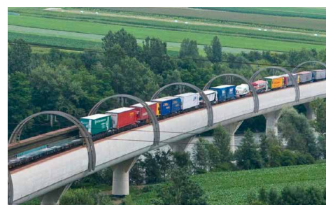
Unser Ziel ist es, den Schwerverkehr auf die Schiene zu verlagern.

Den Ankündigungen und Versprechungen unserer Partner müssen endlich Taten folgen.