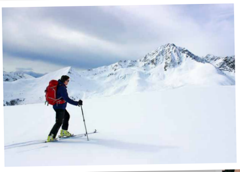
Kraft tanken in der Natur.