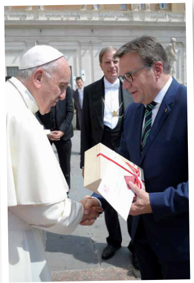
Audienz bei Papst Franziskus.