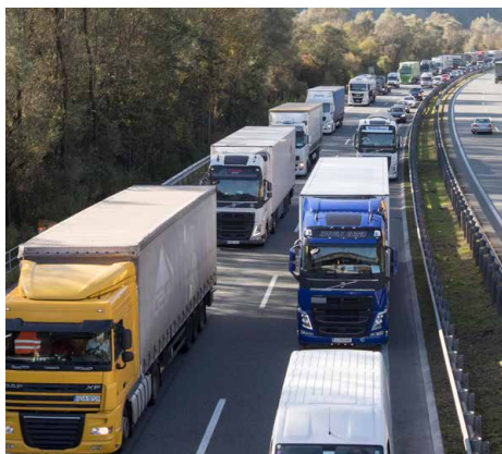
Eine LKW-Obergrenze ist dringend notwendig.

An den mittel- und langfristigen Zielen, die man beim Gipfel in Bozen mittels eines Zusatzprotokolls eingebracht habe, halte man natürlich weiterhin fest, stellt LH Platter klar. Neben den Landeshauptleuten von Tirol, Südtirol und Trentino hat auch Österreichs Verkehrsminister Norbert Hofer das Zusatzprotokoll unterfertigt.