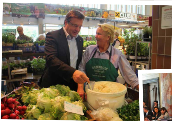
So kennt ihn Tirol: offen und bürgernah.