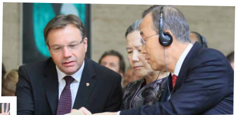
Treffen mit dem ehem. UN-Generalsekretär Ban Ki-moon.